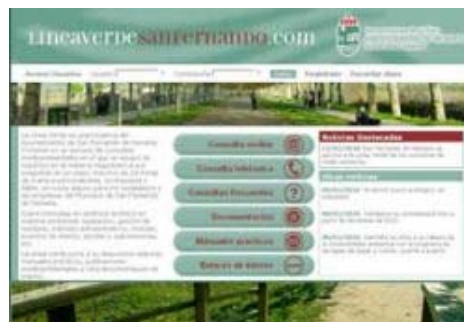
La página web del servicio municipal Línea Verde San Fernando

El servicio municipal gratuito de asesoría medioambiental que funciona desde enero, ya cuenta con 273 personas inscritas (vecinos/as, empresarios, consultoras, etc.) y con miles de visitantes a la información general. Los contenidos más utilizados de momento, han sido las noticias medioambientales y los servicios de consultas frecuentes y consultas online específicas. La asesoría municipal web 24 horas que se puso en marcha con el nombre Línea Verde San Fernando, ha recibido un total de 11.250 visitas en sus tres primeros meses; pero también ofrece la posibilidad de acceder y descargar manuales y documentación específica sobre temas relativos a 'Residuos', 'Energía', 'Hábitos de vida sostenible' o sobre 'Cambio climático', entre otros asuntos.